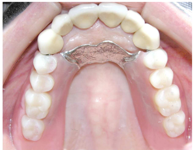
Figura 7- Vista oclusal da PPF com encaixe ASC-52

Em uma extremidade livre bilateral, onde o paralelismo exato dos encaixes não pode ser realizado com exatidão, pode ser usado o sistema de encaixe, chamado botão, como o ERA ou o Octolink.