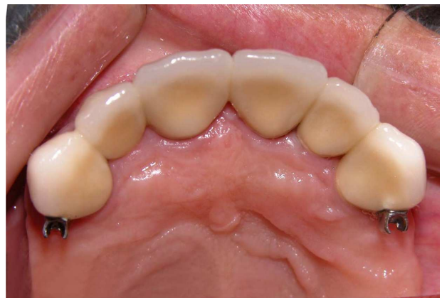
Figura 7- Vista oclusal da PPF com encaixe ASC-52

Quando o suporte osseomucoso é favorável à estabilização, os encaixes Dalbo, Ceka ou ASC 52 podem proporcionar uma solução satisfatória em classe I maxilar. Esta condição não é comum na mandíbula. Os encaixes Dalbo, Ceka dinâmico, ASC 52 monolateral permitem translação vertical e rotação distal vertical. O encaixe esférico de Roach e ASC 52 esférico permitem 3 movimentos: rotação distal vertical, rotação vestibulo lingual e translação vertical. A seguir as figuras ilustram a utilização de encaixe ASC-52 em caso classe I de Kennedy (Figuras. 5-8).