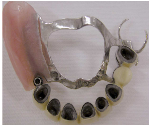
Figura 1- Aspecto interno da PPR e PPF com encaixe ERA

Pesquisas indicam o uso de um encaixe rígido, já que o rebordo residual com uma base corretamente adaptada pode fornecer suporte da mesma forma que os dentes pilares 17 , entretanto oponentes a esta filosofia indicaram que a utilização de um encaixe rígido produziria sobrecarga ao dente suporte e, portanto dano no tecido periodontal 5 . A seguir as figuras ilustram a utilização de encaixe ERA em caso classe II de Kennedy (Figuras 1-4).