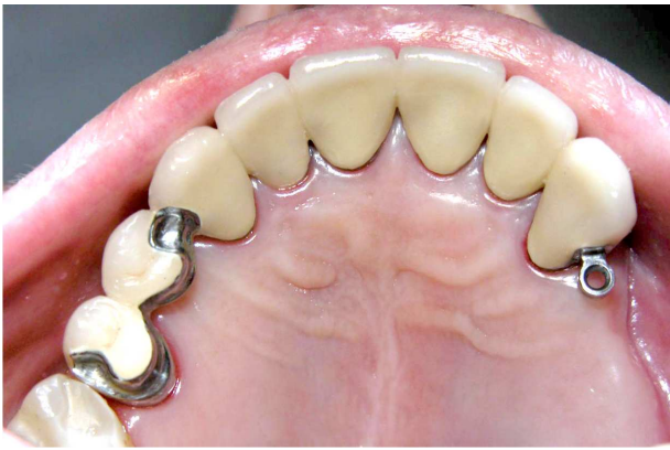
Figura 3- Vista oclusal da PPF com encaixe ERA