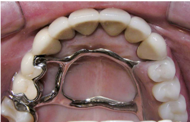
Figura 4- PPR instalada