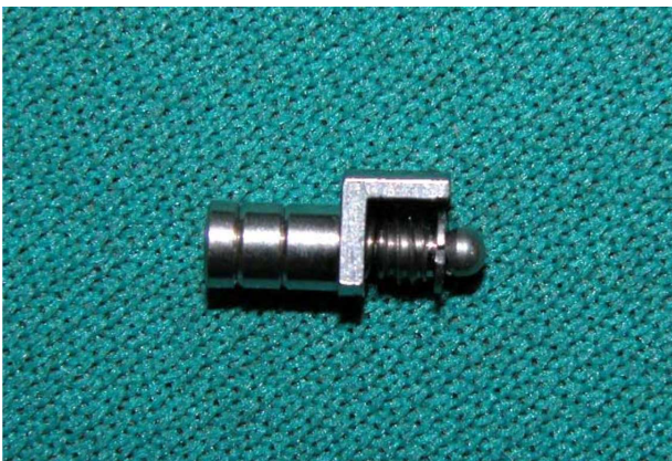
Figura 5- Vista lateral do encaixe ASC-52

Quando o suporte osseomucoso é favorável à estabilização, os encaixes Dalbo, Ceka ou ASC 52 podem proporcionar uma solução satisfatória em classe I maxilar. Esta condição não é comum na mandíbula. Os encaixes Dalbo, Ceka dinâmico, ASC 52 monolateral permitem translação vertical e rotação distal vertical. O encaixe esférico de Roach e ASC 52 esférico permitem 3 movimentos: rotação distal vertical, rotação vestibulo lingual e translação vertical. A seguir as figuras ilustram a utilização de encaixe ASC-52 em caso classe I de Kennedy (Figuras. 5-8).